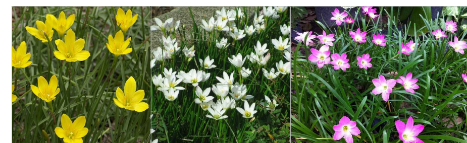
AMARELO BRANCA ROSA