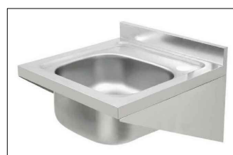
LAVATORIO INDUSTRIAL DE PAREDE MATERIAL: INOX