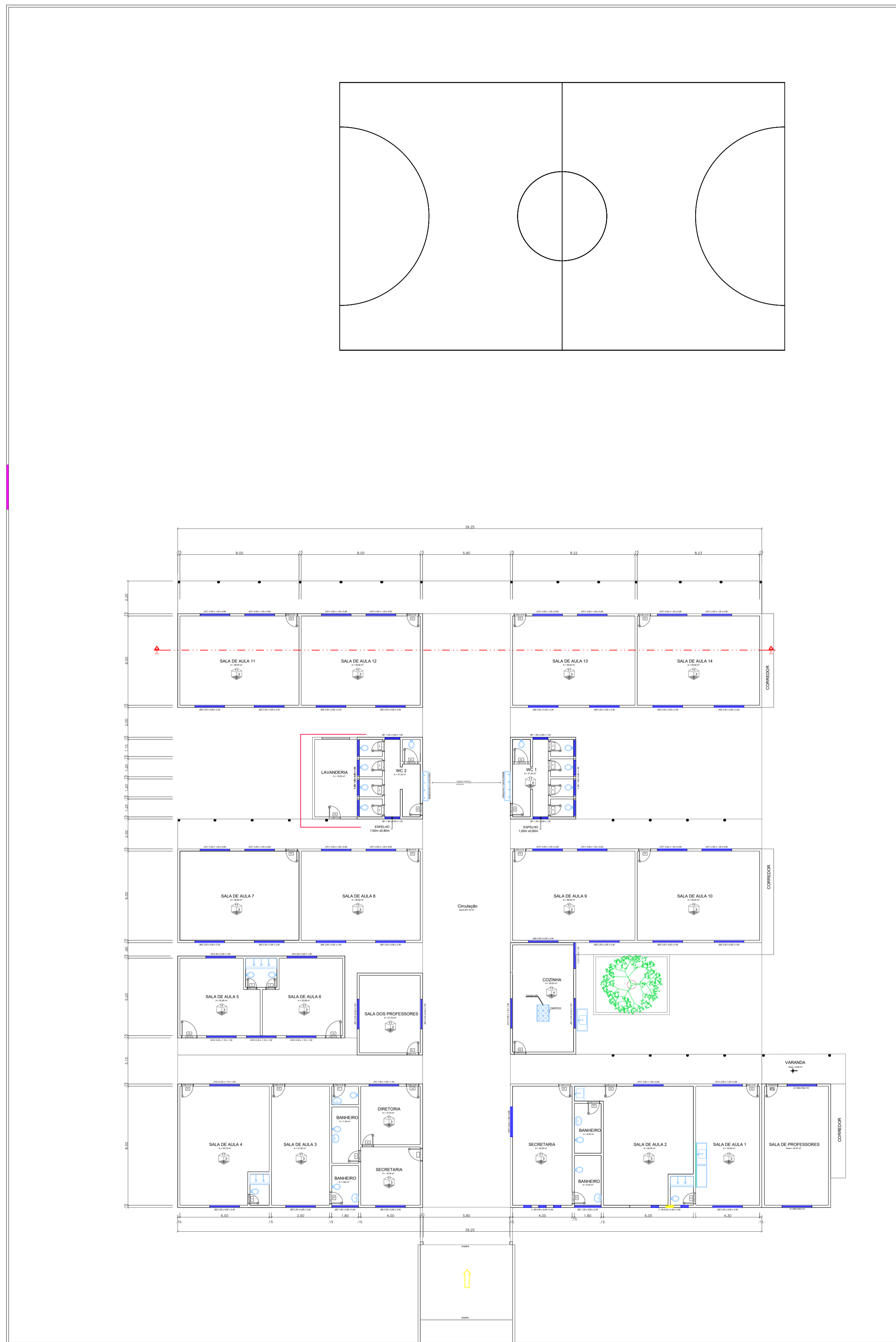
1 PROJETO EXISTENTE ESCALA 1:175