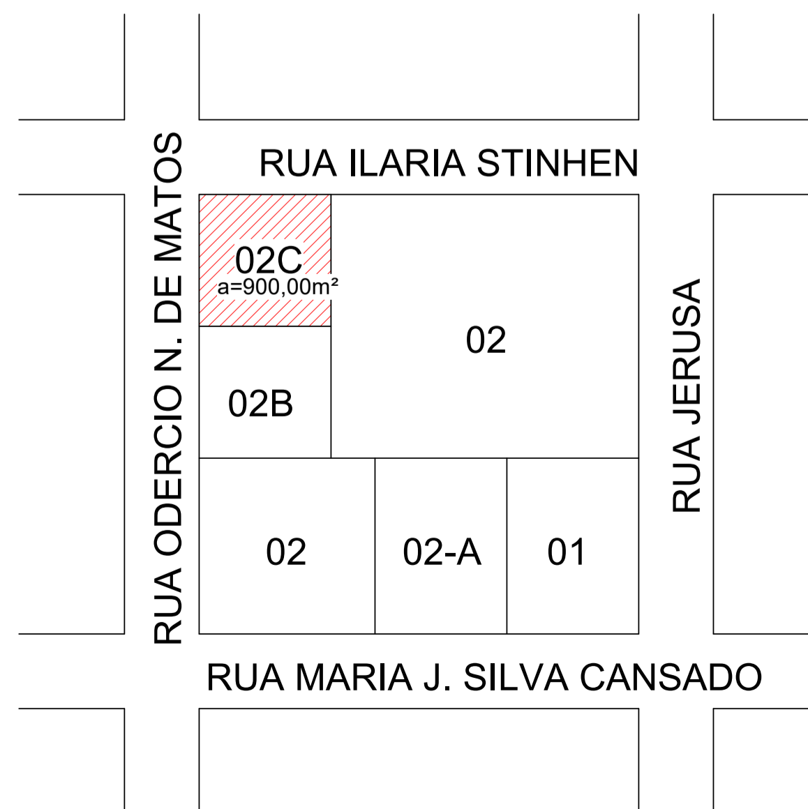
2 Planta de Situação S/ ESCALA