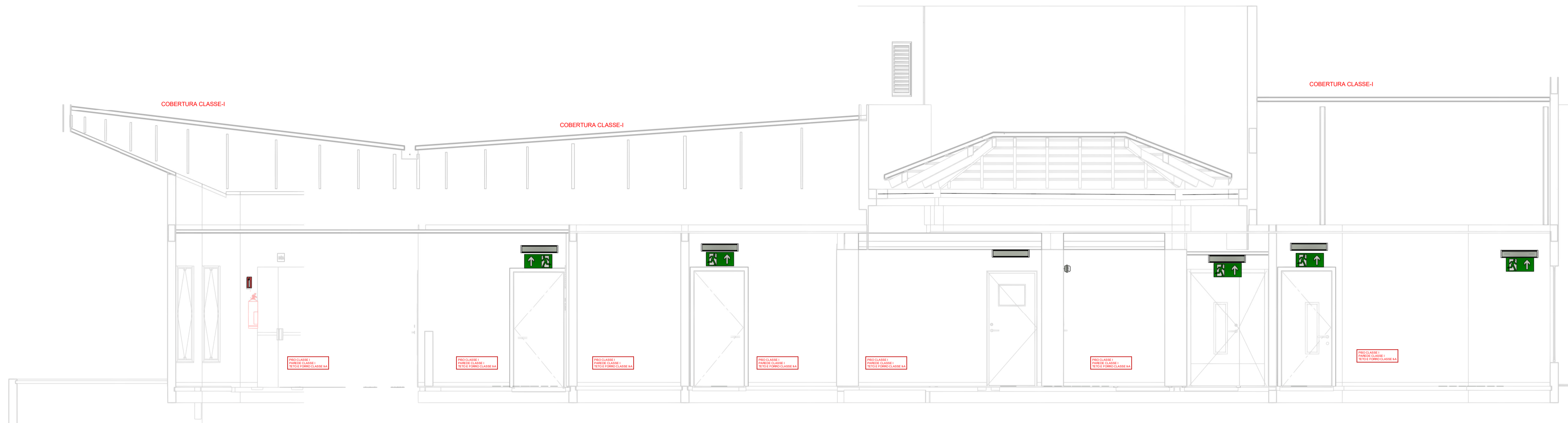
1 Corte AA ESCALA - 1 : 50