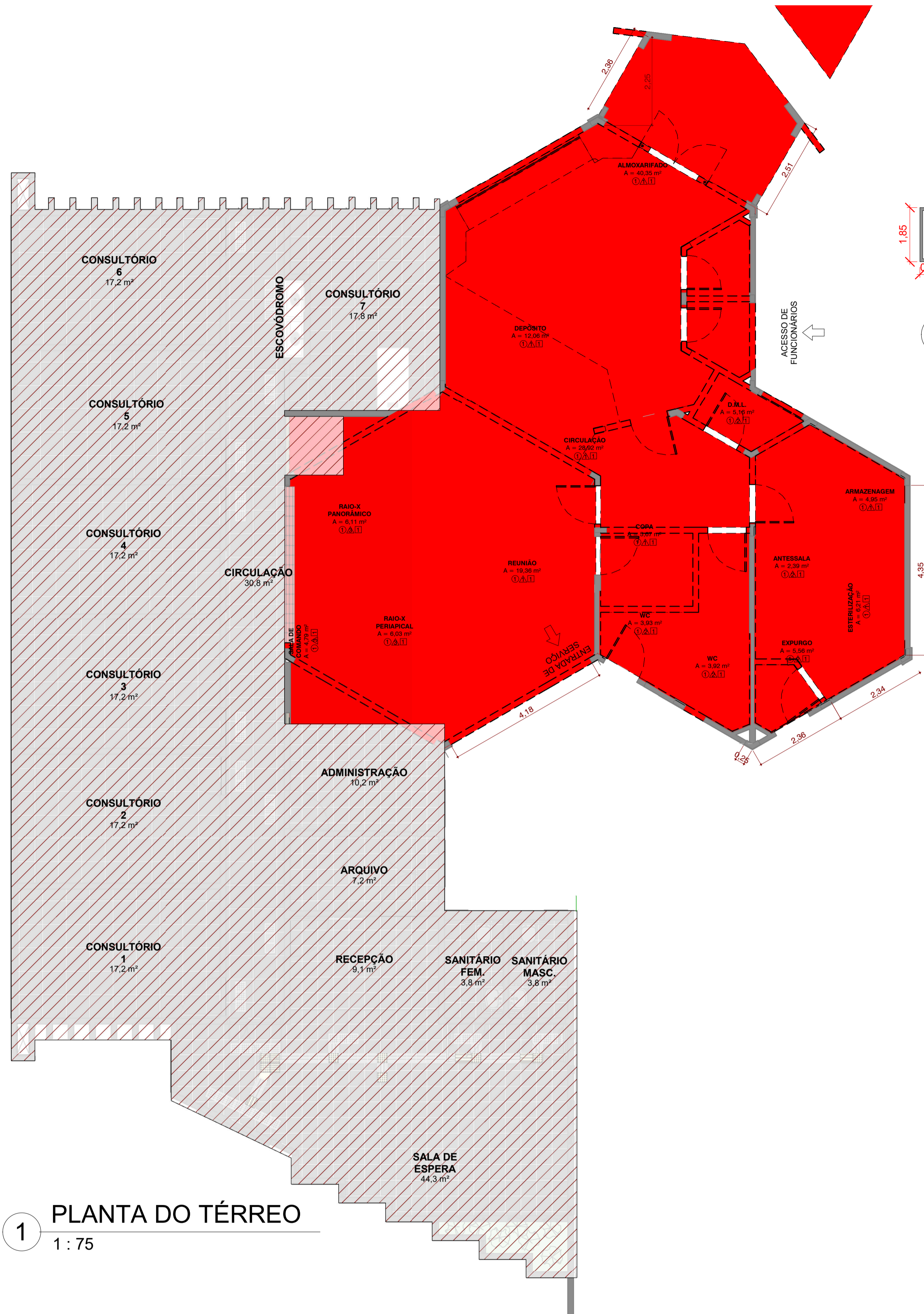
1 PLANTA DO TÉRREO 1 : 75