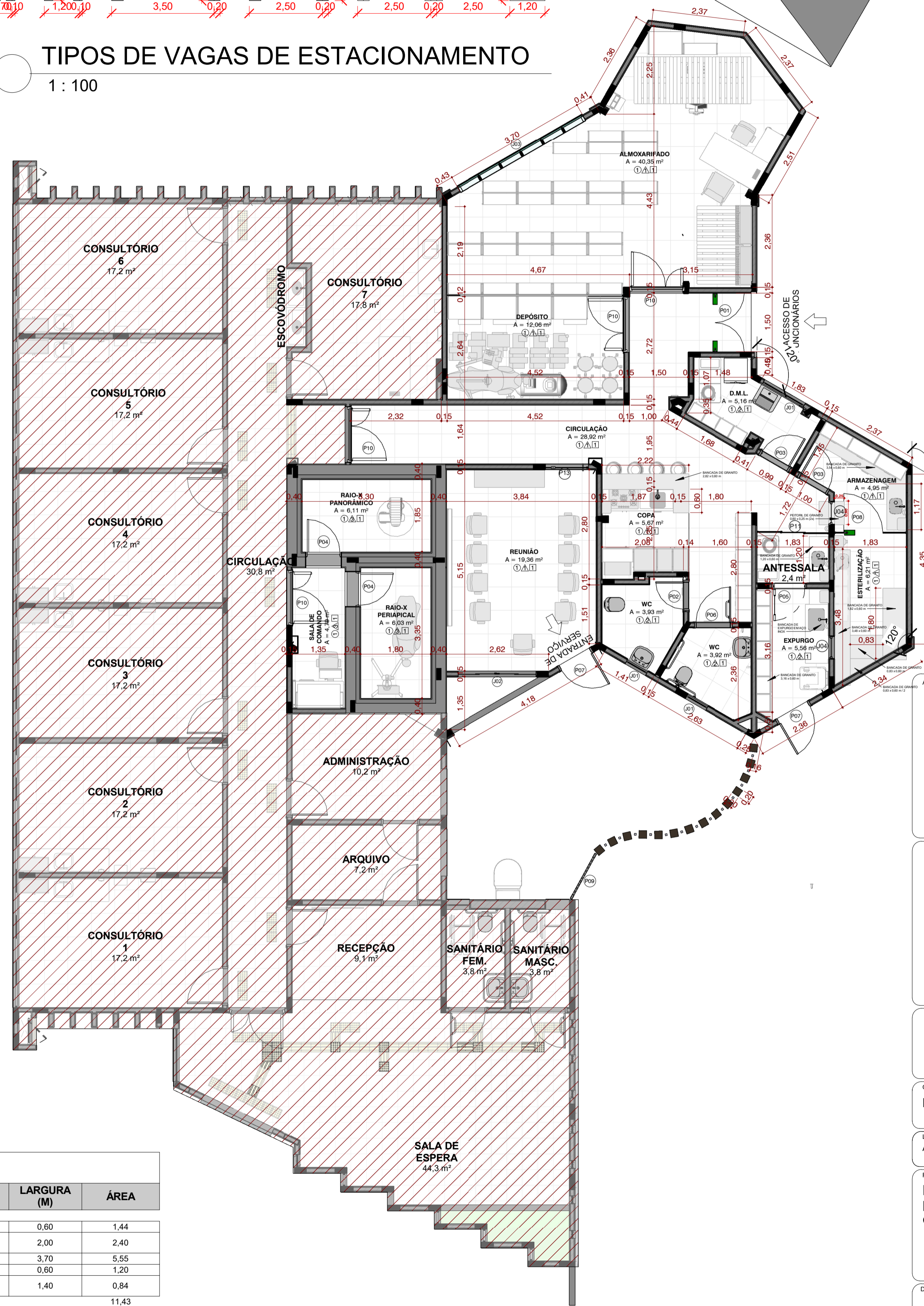
2 PLANTA DO TÉRREO HUMANIZADA 1 : 75